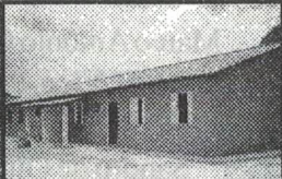
25 Casas populares