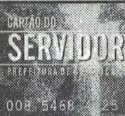
Cartão do Servidor