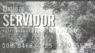
Cartão do Servidor