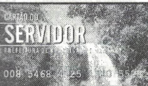
Cartão do Servidor