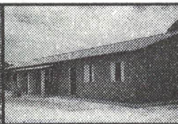
25 Casas populares