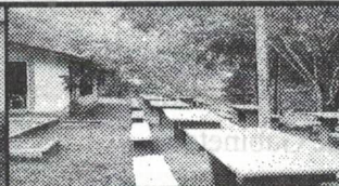
Reforma da Sede da Associação da Amorosa