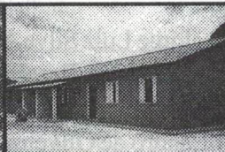
25 Casas populares