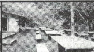
Reforma da Sede da Associação da Amorosa