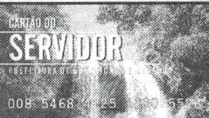
Cartão do Servidor