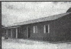
25 Casas populares