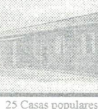
25 Casas populares