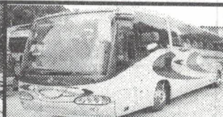
Transporte para os universitários