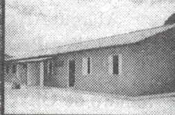
25 Casas populares