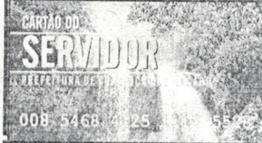
Cartão do Servidor