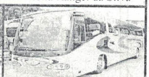
Transporte para os universitários