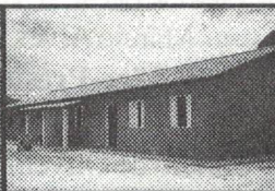
25 Casas populares