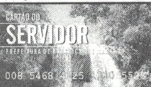
Cartão do Servidor