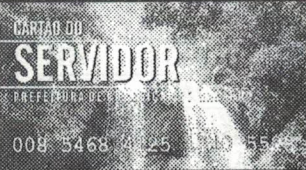
Cartão do Servidor