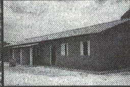
25 Casas populares