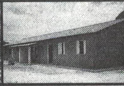
25 Casas populares