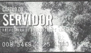
Cartão do Servidor