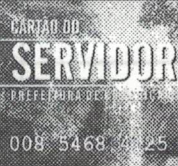
Cartão do Servidor