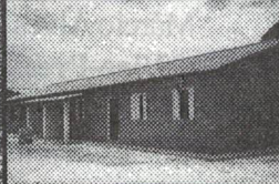
25 Casas populares