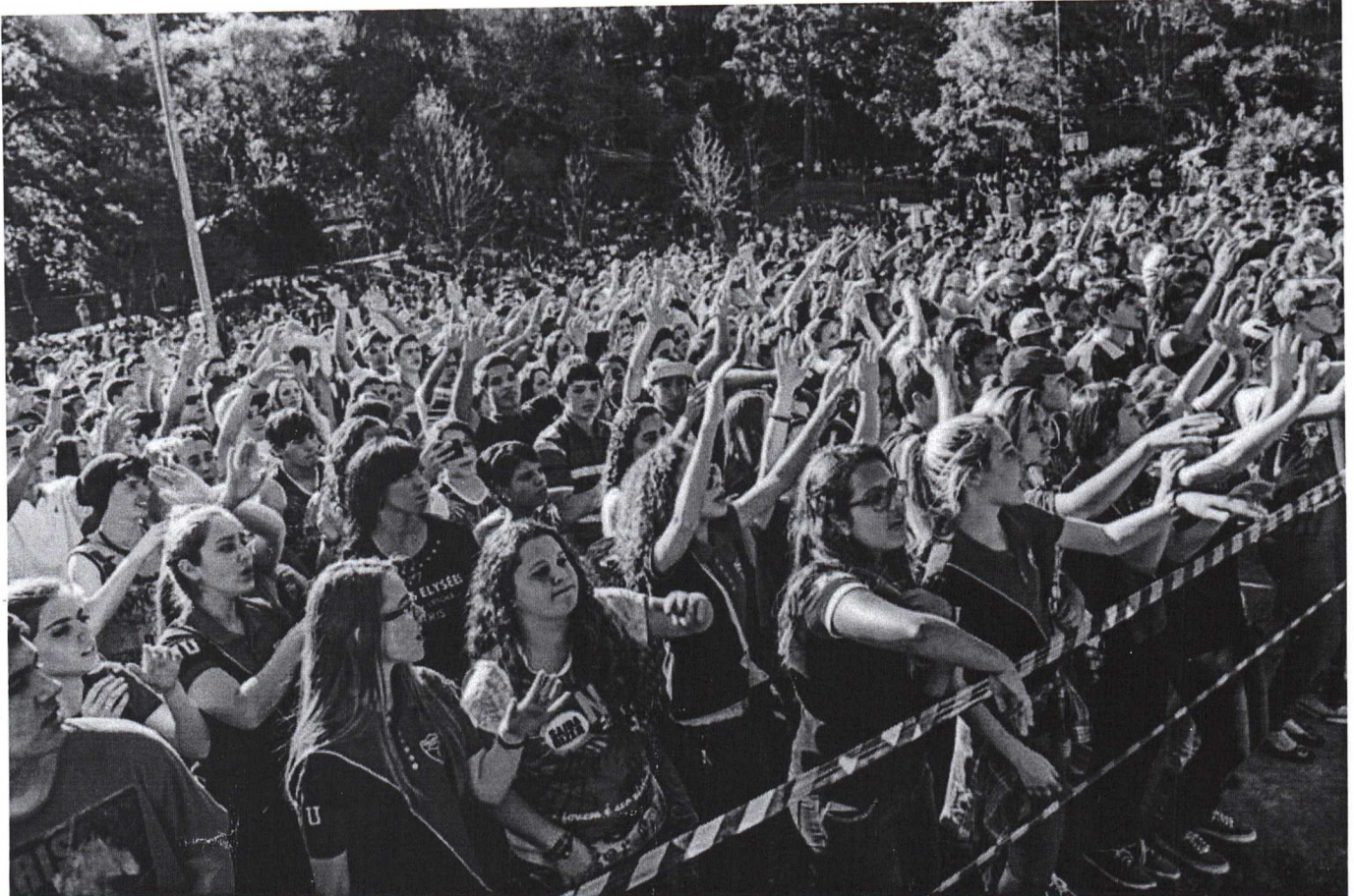
Evento promovido pela FJU em Caxias do Sul (RS), em 2015

O presidente Luiz Inácio Lula da Silva sancionou lei que cria o Dia Nacional da Força Jovem Universal (FJU), a ser celebrado anualmente no segundo sábado do mês de janeiro.